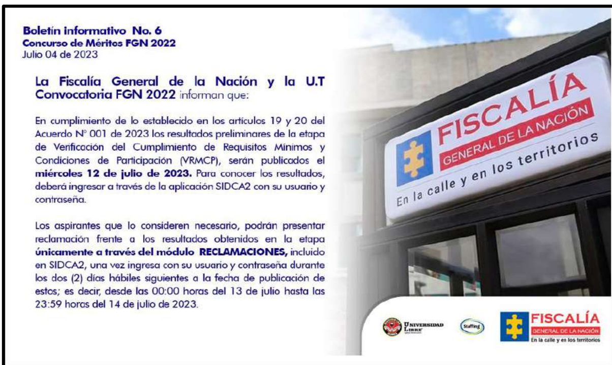
Imagen tomada desde la aplicación SIDCA 2

presentadas por los aspirantes únicamente a través de la aplicación SIDCA 2 desde las 00:00 horas del 13 de julio hasta las 23:59 del 14 de julio de 2023.